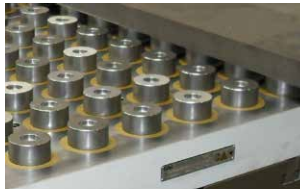
Elektro-Permanent-Magnetplatte mit Verwendung von Polronden