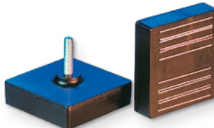
Typ MO 10 - 03