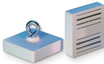
Typ MO 10 - 01

Typ MO 10 - 04 mit Innengewinde M6, schwarz.