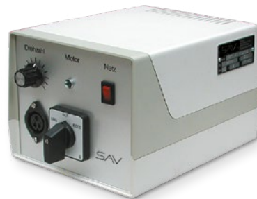
Steuergerät SAV 875.40 B x H x L = 170 x 140 x 230