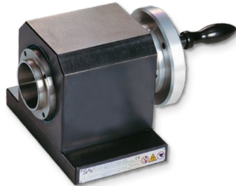
Größe 200 mit SK 40-Aufnahme