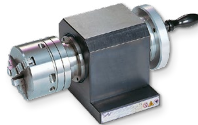
Größe 200 mit Dreibackenfutter (Zubehör)