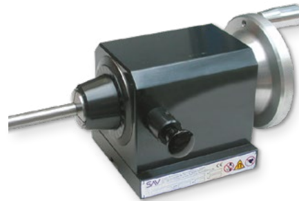
Größe 100 mit Deckel-Aufnahme